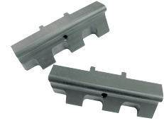
Erweiterungsspannbackensatz zu TP 400