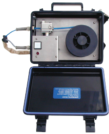
KD 4 mit geöffnetem Haubendeckel