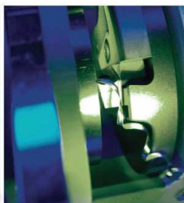
Čelní zarovnání bez ostřin a kolmo