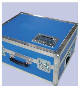
Dodávka v přepravním kufru s výztuhami