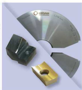
Včetně nožového držáku WH a multifunkčního nástroje MFW (2-břité řezné destičky HSS)