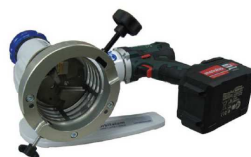
RPG 3.0 Akku