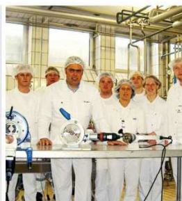
Oblasti použití: Stavba potrubí a zařízení pro výrobu čistých plynů, elektroniky, farmaceutických výrobků, potravin, nápojů, solárních zařízení a pro chemický průmysl.